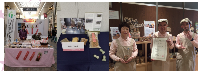
スイーツ甲子園参加の様子

スイーツ甲子園に今年初めて参加し、お陰様でなんと大阪大会でグランプリを受賞することができました。兵庫県の本大会へは黒糖くるみラスクを使つた「さかいラスク」で臨みました。残念ながら入賞は逃しましたが、パッケージや、ディスプレイの仕方など、とても勉強になりました。 本大会では大量の試食と販売用の商品を用意しなければならず、それが繁忙期と重なってしまいました。来る日も来る日もオーブンがフル稼働。利用者さんも退所時間ギリギリまで頑張ってくれました。